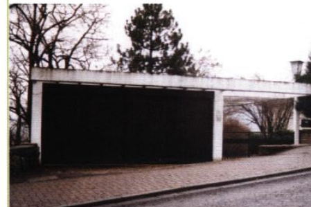
▲ Garage et portique d'entrée au contact de la rue de Haute Corniche