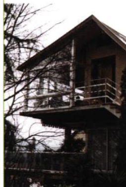
▼ Maison, rue de la Moyenne Corniche

Le principe de la toiture-terrasse, souvent utilisé, permet une bonne intégration de ces constructions au paysage des Coteaux.