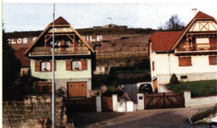
▼ Maisons, route de Boersch

Les matériaux employés pour la construction de ces maisons sont en général toujours les mêmes: la maçonnerie de briques associée au béton armé pour le gros œuvre, le bois pour la charpente, quelques éléments de bardages extérieurs décoratifs, et les menuiseries extérieures (en alternative au PVC), la tuile en terre cuite pour la couverture.