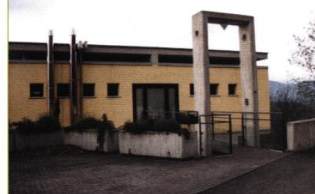
▲ Une passerelle qualifie le contact entre la maison et la rue de la Moyenne Corniche