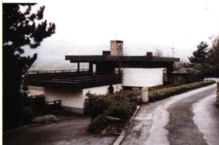
▲ Maison, rue de la Haute Corniche

En général réalisées par des architectes, ces maisons sont dites "modernes" parce qu'elles expriment la volonté d'établir un dialogue subtil avec le site où elles s'implantent tout en offrant à leurs utilisateurs une organisation spatiale originale. "Œuvres uniques", elles se réfèrent néanmoins, par leur forme et leur mode