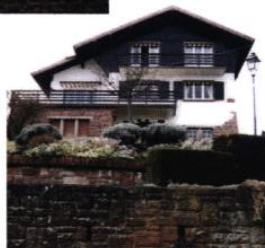
▲ Villas sur terrain en pente surplombant la rue, rue de la victoire et rue de la montagne