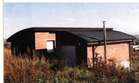
▲ Maison, rue des acacias