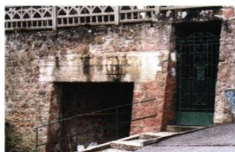
▲ Mur de soutènement, rue de la Montagne