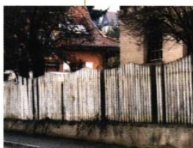
▲ Clôtures, rue Mürner, muret maçonné et grille en fer forgé ou bois