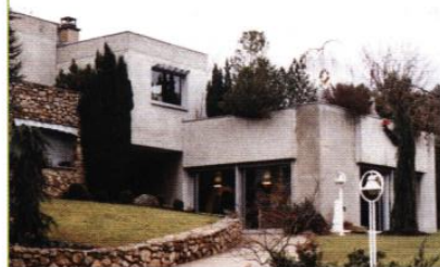
▲ Maison rue des bosquets