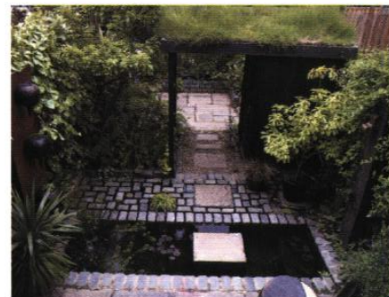
◀ Le jardin comme microcosme