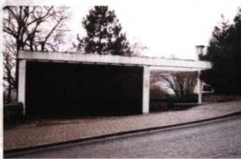
◀ Garage et portique d'entrée implantés sur rue

FICHES DISPONIBLES GRATUITEMENT EN MAIRIE D'OBERNAI ET AU CAUE DU BAS-RHIN