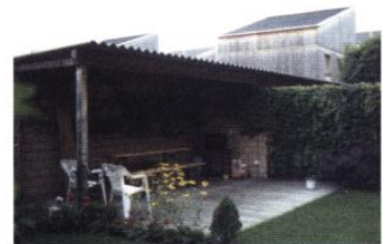
▲ Terrasse couverte adossée au mur de clôture