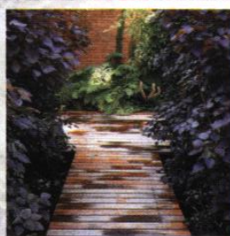
▲ Plancher en bois