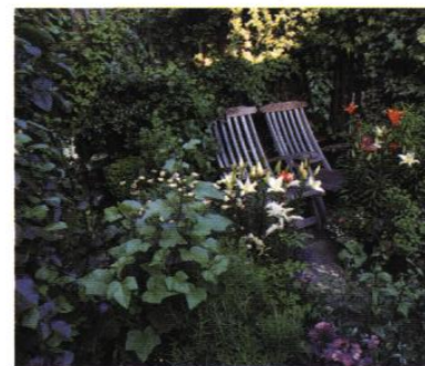
◀ Jardin libre et sauvage