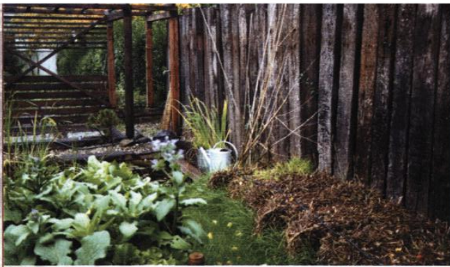
▲ Les traverses de chemin de fer, utilisées en brise-vent, apportent une texture à l'ambiance du jardin