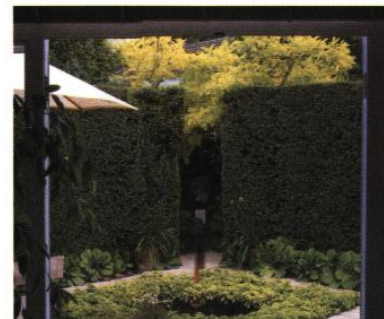
◀ Jardin construit et ordonné