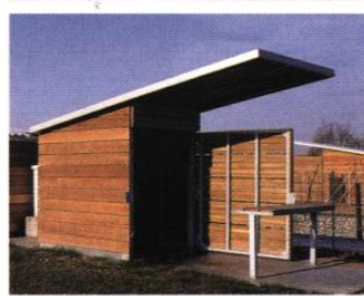
▲ Abri de jardin