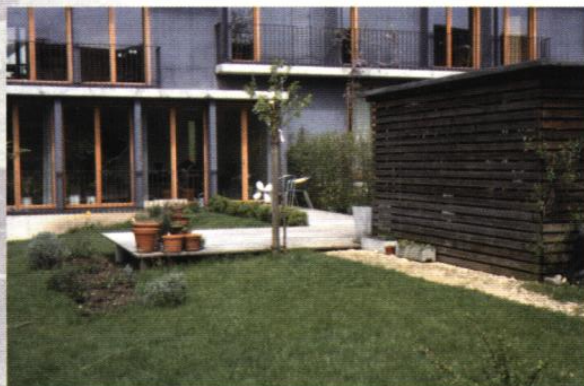
▲ La terrasse est un espace du jardin, elle participe à son aménagement et s'implante en relation avec ses ingrédients (abri de jardin, plancher en bois, plantes en pots...)