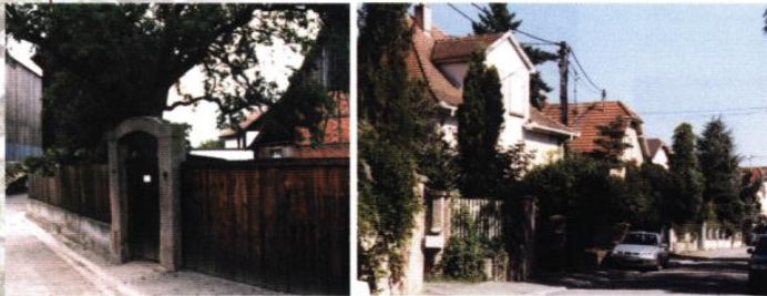
▲ Les clôtures végétales et les arbres de hautes tiges des parcelles privées contribuent à la qualité paysagère du quartier

La clôture séparative peut se fermer, s'épaissir, pour protéger l'intimité de certaines pièces de la maison ou de certains espaces extérieurs. En quelques endroits, au contraire, on peut la rendre plus transparente, plus poreuse, pour permettre une échappée visuelle ou établir un contact avec les voisins.